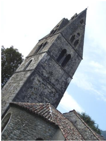
Église de LE GENEVRAY