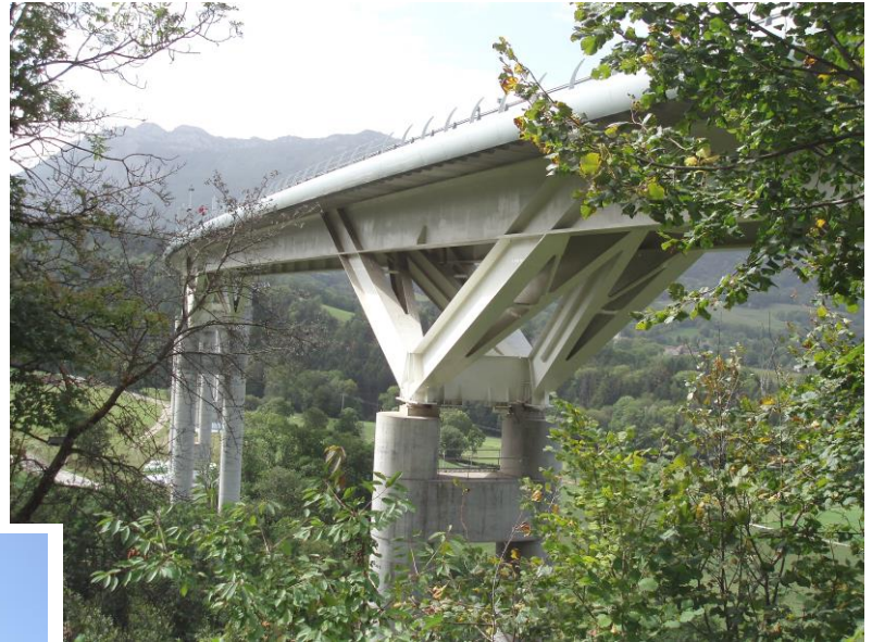
le viaduc autoroutier de MONESTIER de CLERMONT [VERCORS]