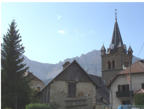
GRESSE-en-VERCORS [vers le GRAND VEYMONT]