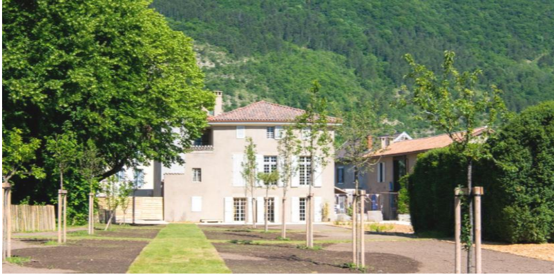
le Musée Champollion à VIF

NB : les photos correspondent aux "épingles" de la carte au 1/100000ème)